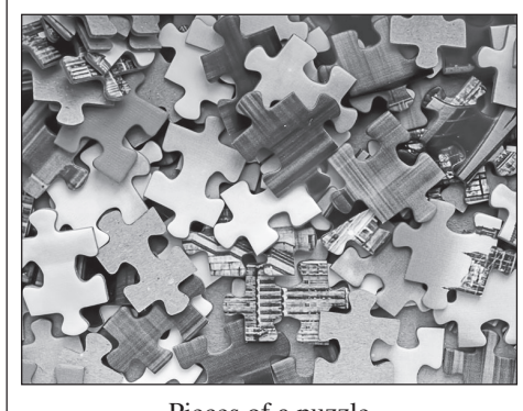
Pieces of a puzzle