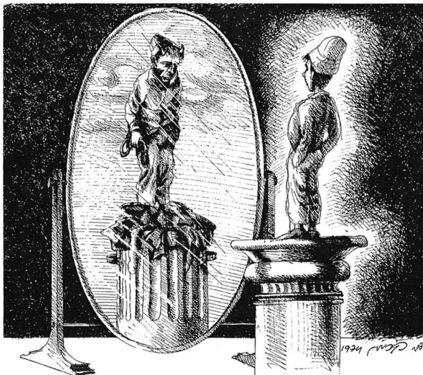
(דני קרמן, זה מה שיש!, זמורה-ביתן-מודן, 1981)

מקור 1 – קריקטורה מאת דני קרמן שפורסמה ב־1974