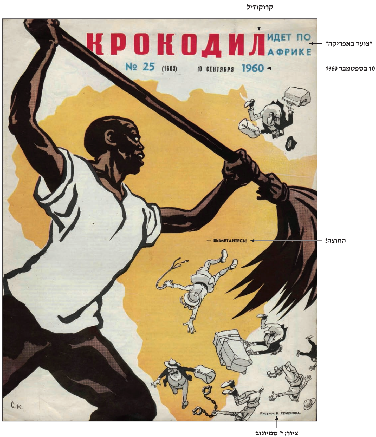
(קרוקודיל, גיליון 25, המפלגה הקומוניסטית של ברית המועצות, 10 בספטמבר 1960)