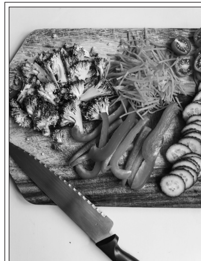
Sliced Vegetables

III Scientists also found that children who eat vegetables every day continue to include vegetables in their diets, even when they are adults. And these adults who eat vegetables have better health and 15 more active brains. So, healthy eating habits that we learn in childhood stay with us and are important later in life, too.