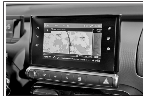
GPS in a car

I Millions of people all over the world use GPS (Global Positioning System) to find their way from one place to another. Taxis and buses have used GPS for several years. Today, most new cars have GPS but if your car doesn't have it, you can buy it in many stores.