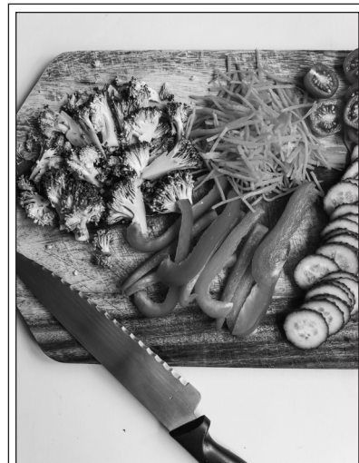
Sliced Vegetables

III Scientists also found that children who eat vegetables every day continue to include vegetables in their diets, even when they are adults. And these adults who eat vegetables have better health and 15 more active brains. So, healthy eating habits that we learn in childhood stay with us and are important later in life, too.