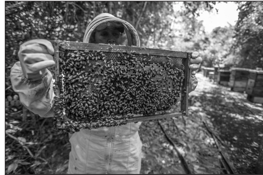
Man with many bees. He's wearing special clothes.