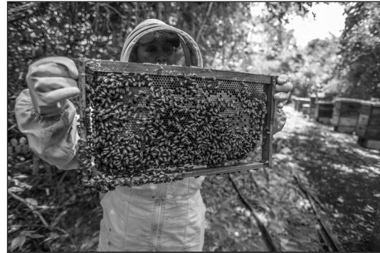
Man with many bees. He's wearing special clothes.

II Fortunately, Police Officer John Davis got the phone call and went to help Sam. John knows a lot about bees because he keeps bees in his own garden. John knows that bees are very important in nature, so he always wants to make sure that no one hurts them. He put on a special white jacket and a special hat to protect himself from the bees. Slowly, he put the bees into a box and then took the box to his garden. Sam thanked John and now he never forgets to close his car window.