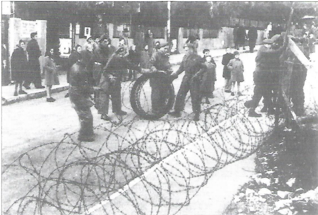
מ' נאור וד' גלעד, ארץ-ישראל במאה העשרים, משרד הביטחון, 1991, עמ' 377

תצלום 1 — ירושלים (סוף תקופת המנדט הבריטי)