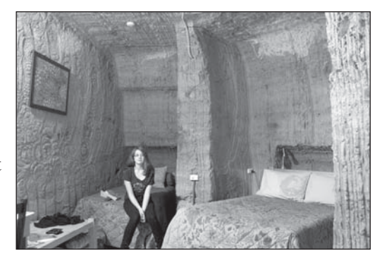
Underground hotel room in Coober Pedy

I There is a treasure in the town of Coober Pedy, Australia. It is a treasure you cannot see because it is under the ground. This treasure is special stones called opals.* Opals are very valuable. Many people come to Coober Pedy to look for opals because they hope to get rich. You can sell a perfect opal for a million dollars.