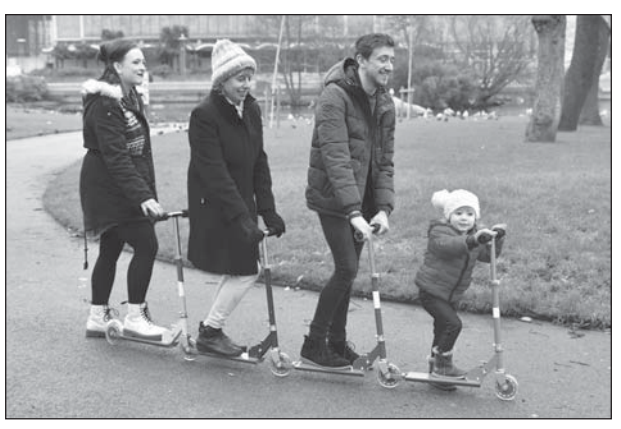
One of the children's inventions