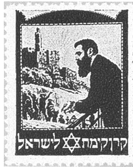
בול קק"ל ועליו דיוקנו של הרצל

בתקופת המעבר מהחלטת האו"ם בכ"ט בנובמבר 1947 ועד הכרזת העצמאות של מדינת ישראל בה' באייר תש"ח (14/5/1948), נזקקה לפתע המדינה לבולים רשמיים. וכך נהפכו בולי קק"ל, בפעם הראשונה בהיסטוריה, לבולים חוקיים לחלוטין למשלוח דואר מארץ-ישראל לרחבי העולם. מצב זה נמשך זמן קצר, ולאחר הכרזת העצמאות החלה המדינה להנפיק בולים משלה, ובולי קק"ל חזרו להיות בולים ייצוגיים. אך מפעל הבולים של "קרן קיימת לישראל" קיים עד היום, והבולים עדיין מספרים את הסיפור של קק"ל ושל מדינת ישראל: הם מתארים את נופי הארץ, היישובים והמוסדות שקמו בה, אישים ידועים, ואת פעילותה של קק"ל במגוון תחומים: יש בולים בנושא סביבה ונוף, בולים בעלי סמל ציוני ובולים שמודפסת עליהם אישיות חשובה.