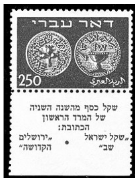
בול "דואר עברי" ושובל

בעיה אחרת הייתה שרוב האנשים לא ידעו לקרוא את הכתב העברי הקדום שהיה על המטבעות העתיקים. דוד רמז 2 , שנוסף על תפקידיו הציבוריים היה מעורב בהנפקת הבולים, הציע שמתחת לבול יוסיפו עוד פיסת נייר ועליה הסבר על תוכן הבול. כך החלו להוסיף לכל בול "דואר עברי" שובל – ספח ובו הסבר קצר על המטבע המודפס על הבול. מאז לכל בול ישראלי נוסף שובל והוא חלק בלתי נפרד מן הבול. היום רוב האספנים של בולי ישראל לא ירצו לקבל בול ללא שובל. במשך השנים המשיכו להנפיק את סדרת הבולים הזו, וכמו כן הוסיפו לה מטבעות יהודיים מתקופות אחרות ושינו את הכיתוב מ"דואר עברי" ל"ישראל".